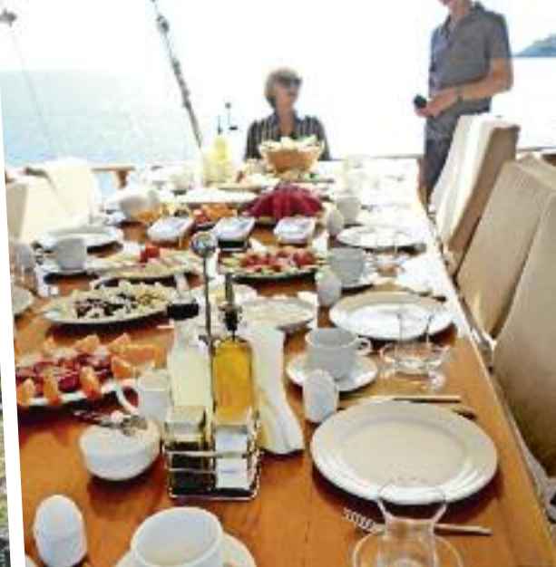
Het ontbijt ontlokt elke dag een applausje bij de passagiers. Vers fruit, feta, Turkse honing... Aan alles is gedacht!