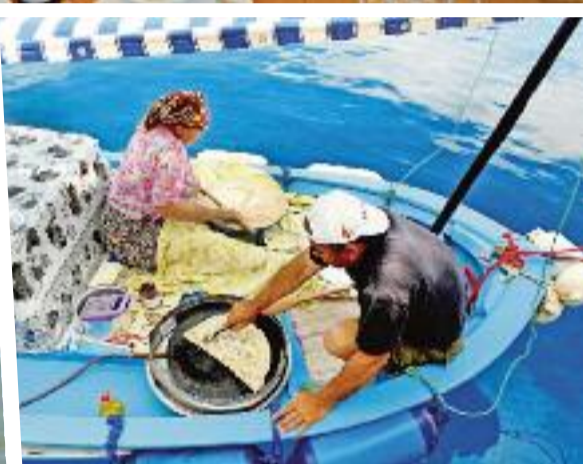
Elke dag komt er wel een bootje 'aanmeren' aan de Naviga om ijsjes of fruit te verkopen, of met gözleme, typisch Turkse pannenkoeken.