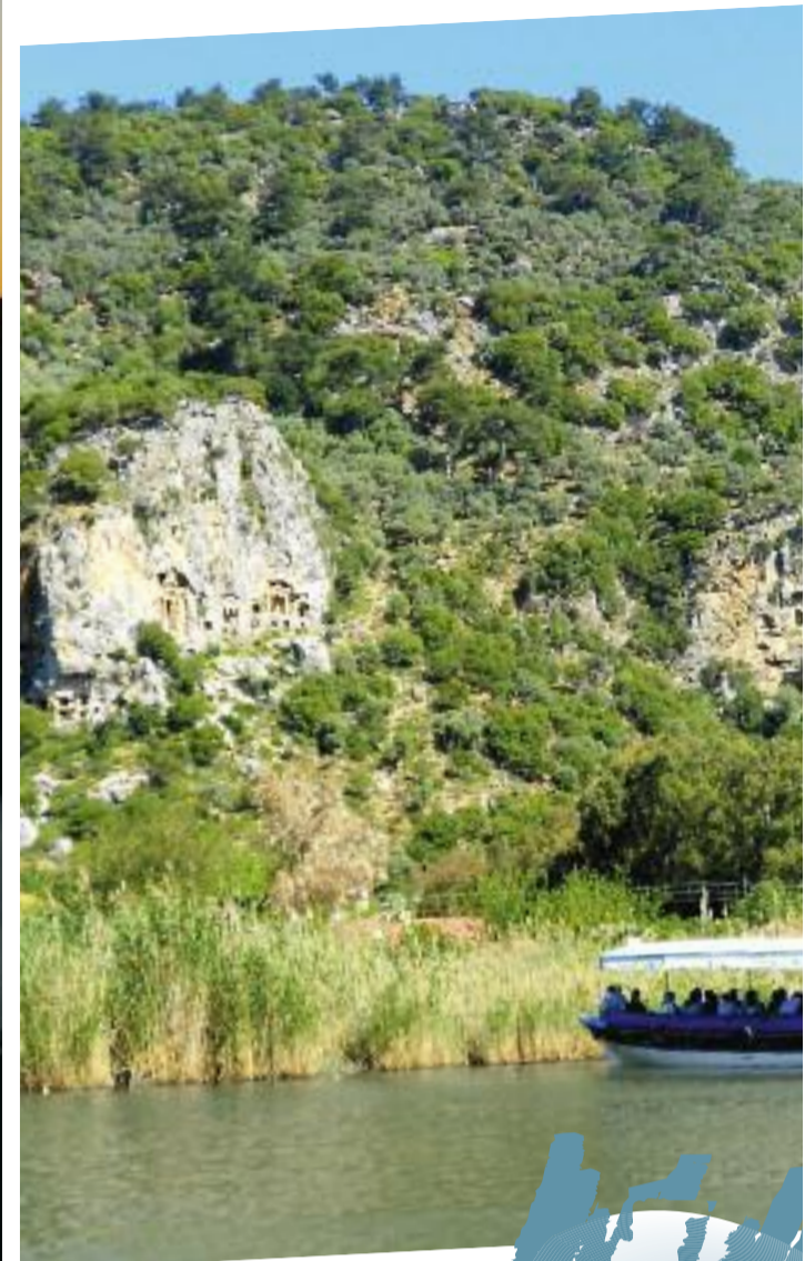
De Lycische graftombes in de buurt van Dalyan kan je bezichtigen vanaf een rivierboot.