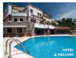
HOTEL 4 REASONS