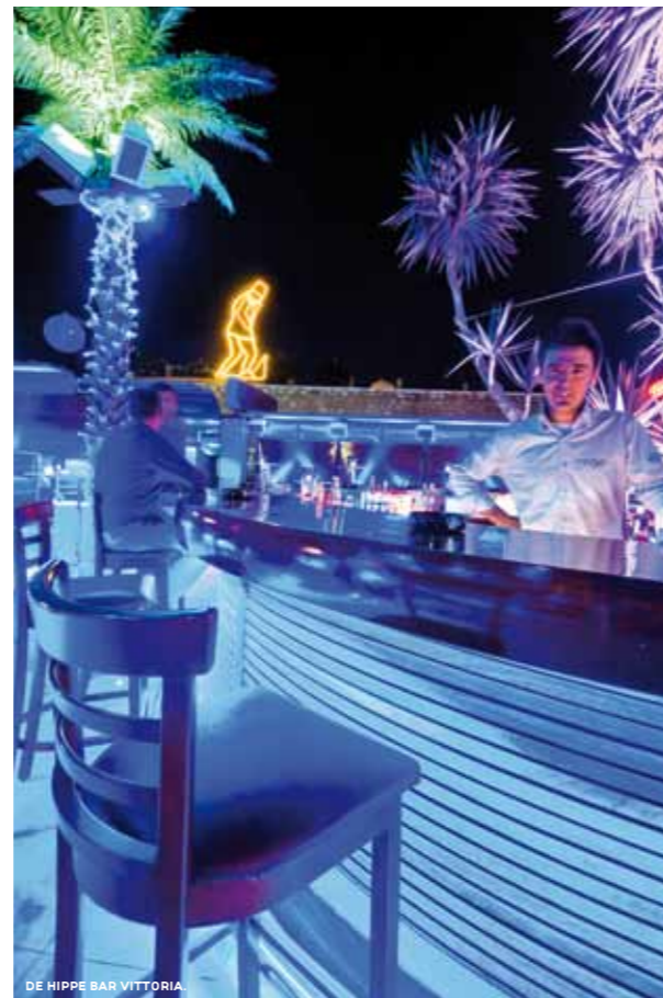
DE HIPPE BAR VITTORIA