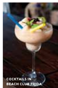
COCKTAILS IN BEACH CLUB FRIDA